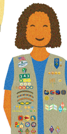
Ambassadors Grades 11-12