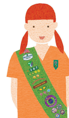
Juniors Grades 4-5