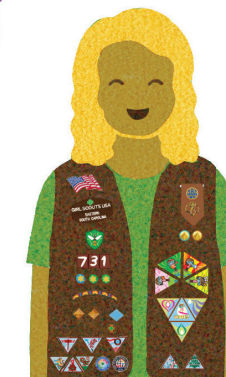
Brownies Grades 2-3