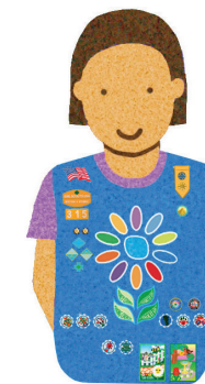
Daisies Grades K-1

Una Juliette o Girl Scout miembro individual, tiene la misma experiencia que las Girl Scouts que son parte de una tropa. Si usted es una familia Juliette, conéctese con su concilio para recibir apoyo y estar al día de los emocionantes eventos para toda la familia.