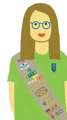
Seniors Grades 9-10