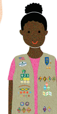
Cadettes Grades 6-8